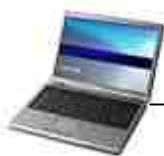
Laptop / Netbook