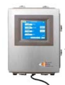
Messenger mit Panel- PC