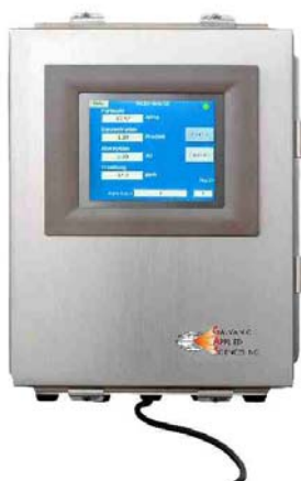
Messenger mit integriertem Panel PC